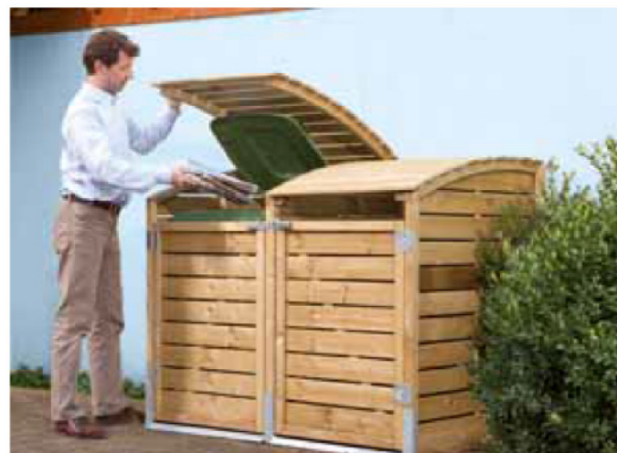
Einhausung der kleinen Mülltonnen; große Mülltonnen werden abgezäunt