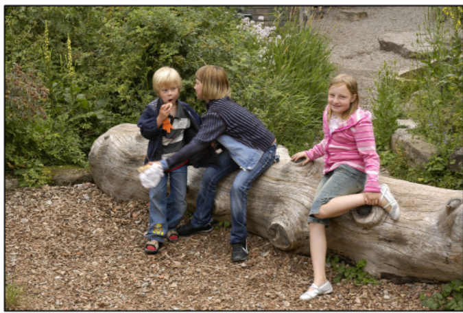
Baumstämme für unterschiedlichste Nutzungen (Sitzen, Klettern, Balancieren u.ä.)