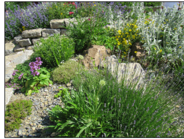
Bepflanzung mit heimischen Pflanzen der Magerstandorte