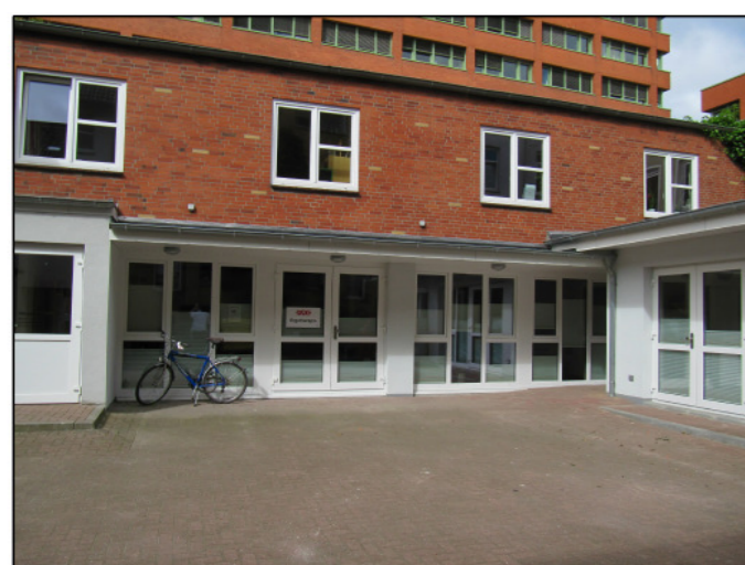
Zustand Innenhof vor der Umgestaltung: komplett gepflasterte Fläche ohne Bewuchs und mit frei stehenden Mülltonnen