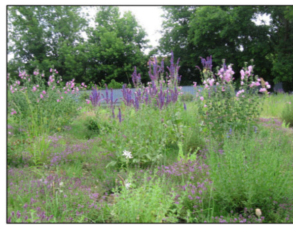
Bepflanzung mit heimischen Pflanzen