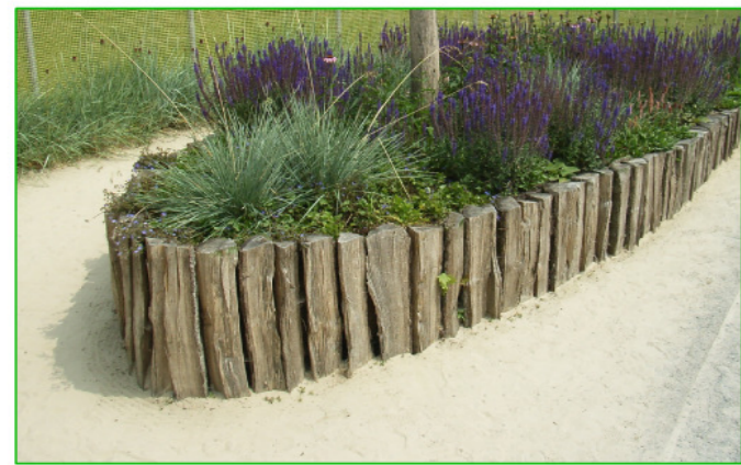
Hochbeete aus Eichenspaltholzpfählen; sie dienen als Strukturbildner durch unterschiedliche Höhen und als Abstandhalter zwischen verschiedenen Nutzungen; mit dauerhafter Bepflanzung und zur gärtnerischen Nutzung