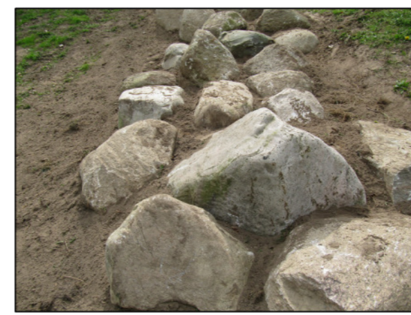
Steine zum Sitzen und Klettern